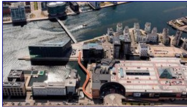
„The Bicycle Snake“ by Dissing+Weitling